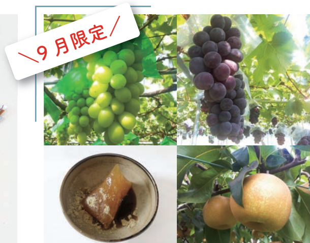
“くだもの王国”の厳選旬セット ④『フルーツセット』3,000 円