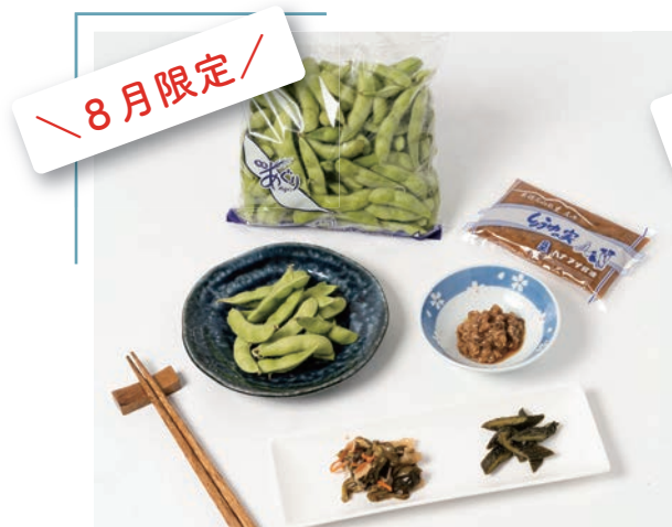
くしびきの夏、勢揃い！ ③『えだまめセット』3,000 円