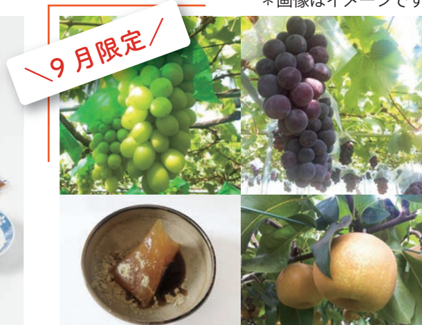
果物倍増！“くだもの王国”の厳選旬セット ②『くしびき長月セット』5,000 円