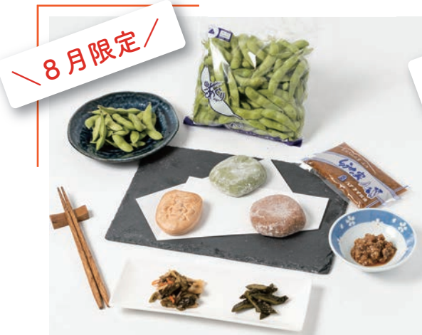
茶豆増量！くしびきの夏、勢揃い！ ①『くしびき葉月セット』5,000 円