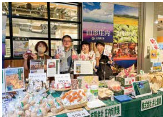
首都圏販売の様子