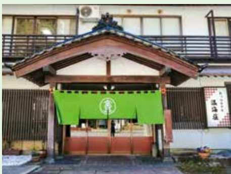
暖簾（あつみホテル温海荘）