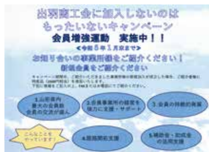
加入キャンペーンチラシ